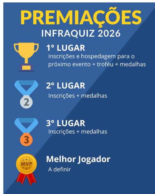
Figura 1 - Premiações